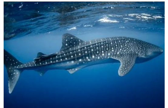
Whale Shark – کوسه نهنگ

اگر به غواصی علاقه‌مند هستید و قصد دارید در اعماق دریا با این موجودات شگفت‌انگیز روبه‌رو شوید، اطلاعات ارائه شده در این مقاله می‌تواند شما را با کوسه‌های مختلف و رفتار آن‌ها آشنا کند. از کوسه‌های بزرگ و ترسناک گرفته تا گونه‌های کوچک و آرام‌تر، هر کدام از این کوسه‌ها دنیای جذاب و منحصر به فردی دارند که می‌تواند تجربه غواصی شما را به یادماندنی‌تر کند. به همین دلیل، آشنایی با انواع کوسه‌ها نه تنها برای بهبود تجربه غواصی بلکه برای درک بهتر آنها اهمیت دارد.