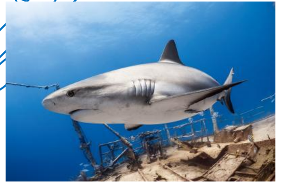
Grey Reef Shark – کوسه مرجانی خاکستری

کوسه گورخری در برخی نقاط دنیا مانند استرالیا به نام کوسه پلنگی مشهور است در حالی که در دیگر نقاط دنیا کوسه پلنگی نوع دیگری از کوسه است. کوسه‌های گورخری به طور معمول در اقیانوس آرام و اقیانوس هند، از ژاپن و استرالیا تا دریای سرخ یافت می‌شوند، در حالی که کوسه‌های پلنگی عمدتاً در شرق اقیانوس آرام، از خلیج کالیفرنیا تا سواحل مکزیک زندگی می‌کنند. این تفاوت‌های جغرافیایی می‌تواند به شناسایی صحیح این دو گونه کمک کند.